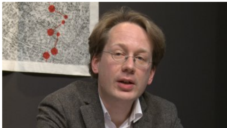
Tobias Bleek : « Parler kurtágien » - Réflexions sur le rôle de l'interprète dans la musique de György Kurtág