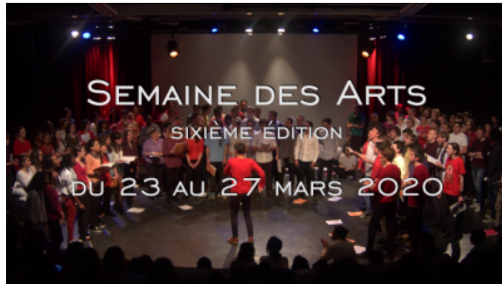
Trailer de la Semaine des Arts