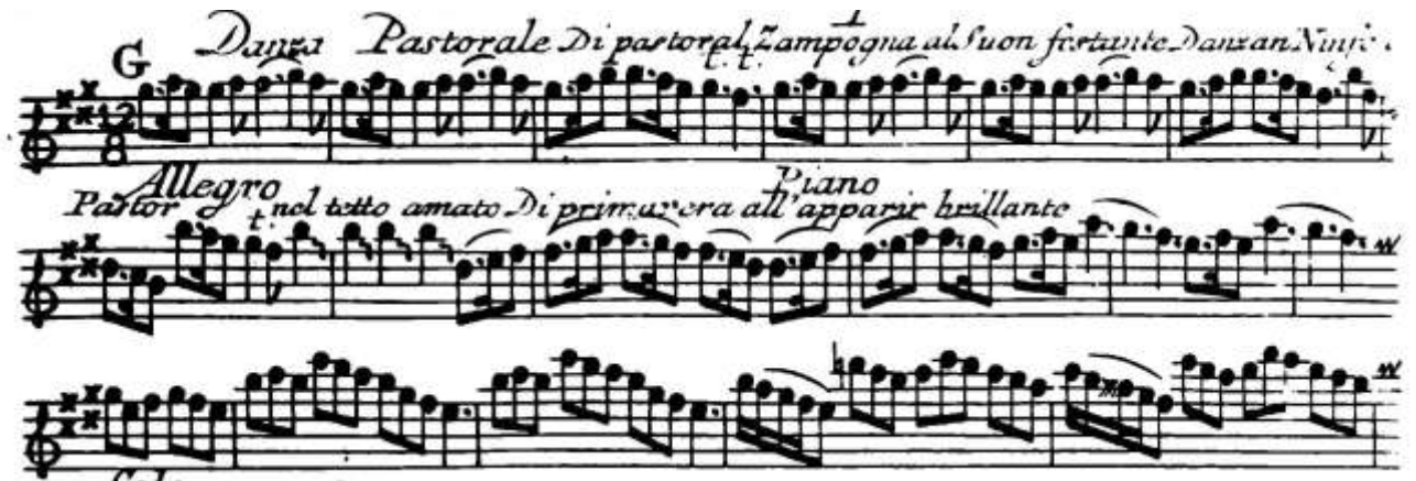
Antonio Vivaldi, Le printemps , 3 e mouvement (extrait)