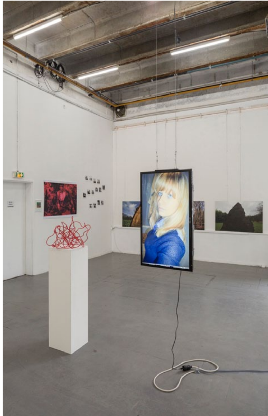
Mains d'oeuvres, 2015