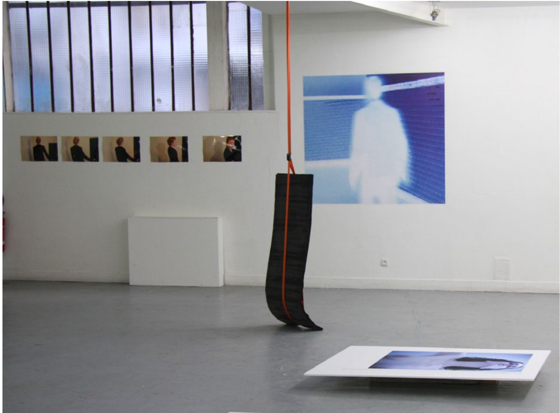
Espace des Arts sans Frontières, 2013